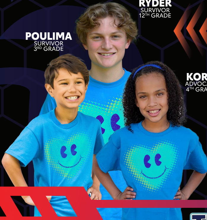
KORA ADVOCATE 4 TH GRADE

By participating in American Heart Challenge your student will collect donations to help other kids with special hearts while having fun and learning how to keep their own hearts, bodies and brains healthy.